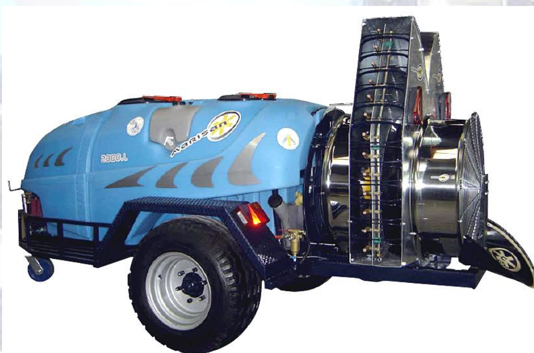
BALBASTRE Y SANJAIME SL MARISAN