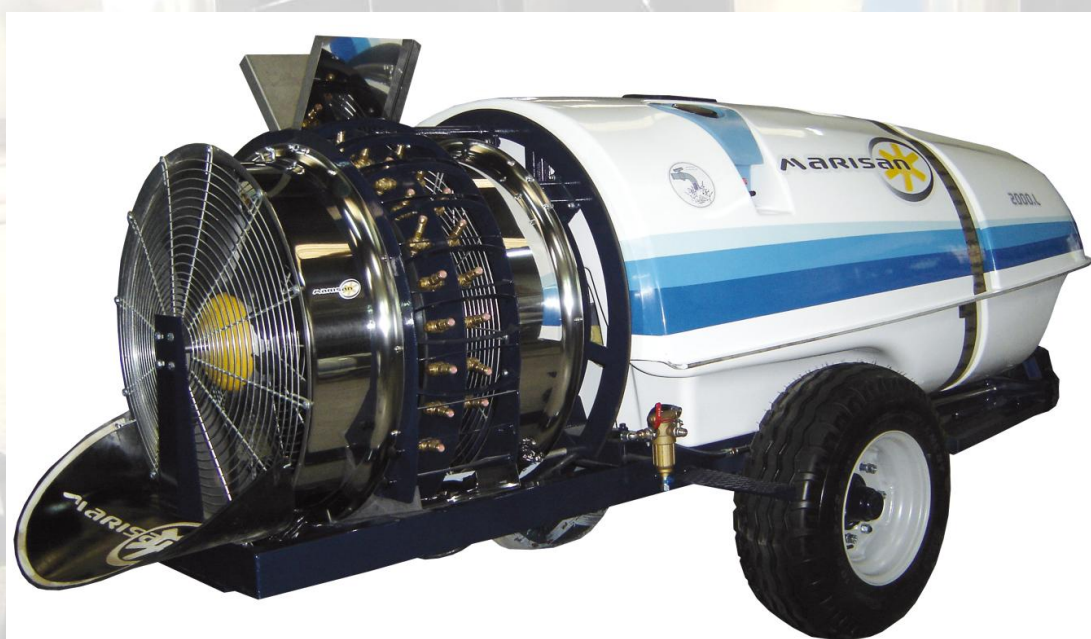
BALBASTRE Y SANJAIME SL MARISAN